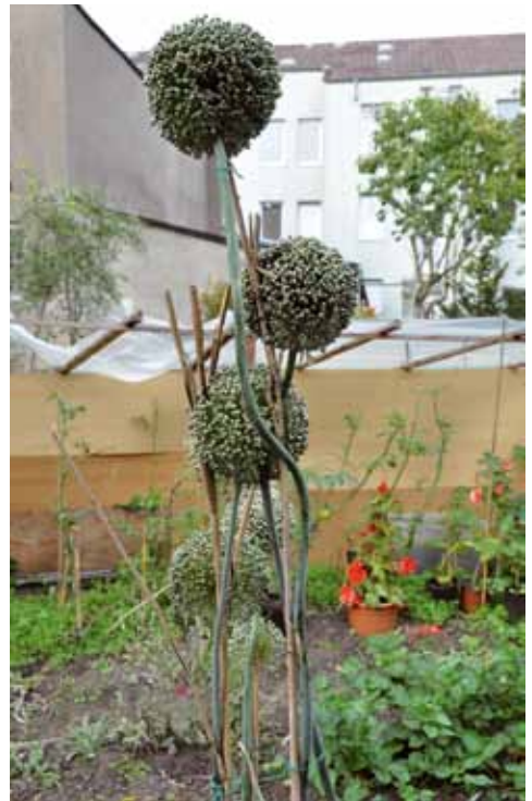
Beispielfoto für den Fotokalender 2012

Wir wünschen Ihnen viel Spaß beim Lesen und ein frohes Osterfest!