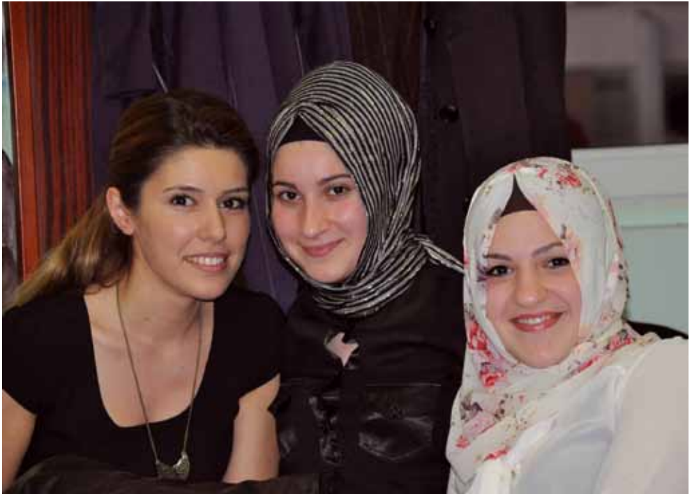
Frauenfest am 30.09.2011

Auch für das Jahr 2012 stehen dem Vicelinviertel über den Stadtteilfonds wieder insgesamt 15.000 Euro für kleinere, in sich abgeschlossene Maßnahmen zur Verfügung, die