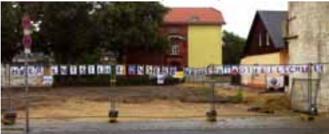
Kieler Straße 90

Das Jahr 2012 verspricht in Bezug auf die Entwicklung der Stadteilschule viel Neues. Der Startschuss für den Bau des neuen Gebäudes der Stadteilschule auf dem Grundstück der Kieler Straße 90 ist gefallen. Die Sanierungsarbeiten im Altbau gehen weiter. Es werden Planungsworkshops für die Gestaltung des Schulhofes stattfinden. Auch im Stadteiltreff in der Containeranlage auf dem Schulhof wird es neben den etablierten auch neue interessante Angebote geben.