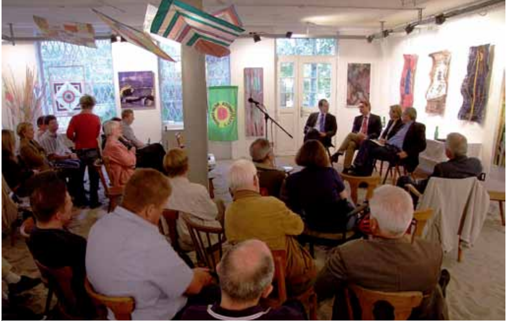
Diskussion zum kommunalen Atom-Ausstieg