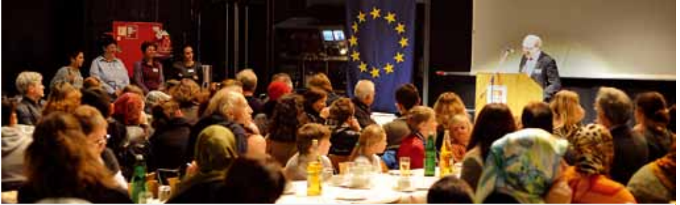
Abschlussveranstaltung Stärken vor Ort

Nach dem dritten Förderjahr endete das erfolgreiche ESF-Bundesprogramm STÄRKEN VOR ORT planmäßig am 31.12.2011. Das Programm STÄRKEN VOR ORT übernahm das bewährte Konzept „Lokales Kapital für soziale Zwecke“ aus dem gleichnamigen Vorgängerprogramm.