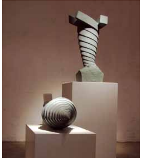
Skulptur von Jo Klein

die zur gleichen Zeit an verschiedenen Orten im Stadtgebiet stattfinden. Angedacht sind weiter ein- bis zweitägige kunsthandwerkliche Ausstellungen oder auch Events, die an einem Nachmittag oder Abend stattfinden. Interessierte Veranstalter können die Galerie-Räume für ihre Zwecke auch anmieten.